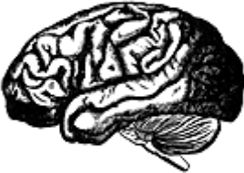
B. — Brain of the Bushman Venus

FAKT 18: Kromě rozdílu ve váze mozku roste negroidský mozek po pubertě méně než bělošský. Ačkoliv se negroidský mozek a nervový systém vyvíjí rychleji než mozek bělošský, jeho rozvoj se zastavuje v dřívějším věku, což omezuje další intelektuální vývoj. 22 27