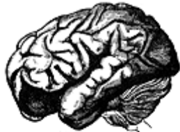
A. — Brain of an Orangutan

FAKT 17: Bylo zpracováno množství srovnávacích studií váhy mozků bělochů a negroidů s tím výsledkem, že negroidský mozek má nižší hmotnost v rozmezí 8-12 procent. Tyto studie provedli Bean, Pearl, Vint, Tilney, Gordon, Todd a další. 23 27