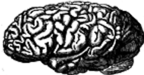
C. — Brain of Gauss (mathematician)

FAKT 20: Čelní laloky, které jsou zodpovědné za abstraktní myšlení, jsou u negroidského mozku v poměru k tělesné hmotnosti menší, jsou méně štěpené a mají jednodušší strukturu než mozek bělošský. 9 27 23 22