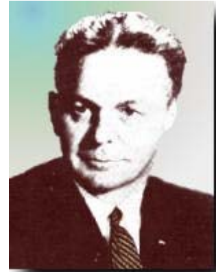
William C. Sullivan

Podľa námestníka riaditeľa Sullivana, ktorý mal priamy prístup k záznamom o sledovaní Kinga, ktoré sú dnes americkému ľudu odopreté, King spreneveril a zneužil podstatnú časť peňazí z príspevkov pre hnutie za „občianske práva“. King používal peniaze SCLC na kúpu alkoholu a zaplatenie mnohých prostitútok, čiernych i bielych, ktoré boli privádzané do jeho hotelových izieb, často v páre, na opilecké sexuálne orgie, ktoré niekedy trvali niekoľko dní. Tento druh aktivít bol normou na Kingových rečníckych a organizačných turné.