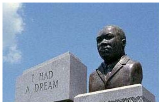
A monument to the new regime's hero.

KEĎ SA KOMUNISTI ZMOCNILI nejakej krajiny, jednou z prvých vecí, ktorú vykonali, bolo skonfiškovanie súkromne držaných zbraní, aby ľudí zbavili fyzickej schopnosti odporovať tyranii. No oveľa zákernejšou než krádež zbraní ľudu je krádež ich dejín. Oficiálni komunistickí „historici“ prepisovali históriu, aby zodpovedala existujúcej stránickej línii. V mnohých krajinách boli oslavovaní národní hrdinovia vymazávaní z učebníc dejepisu, ich činy prekrúcané v prospech komunistickej ideológie, a komunistickí vrahovia a zločinci boli premenení na oficiálnych „svätcov“. Na počesť týchto zverov, ktoré povraždili mnohé národy, boli vyhlasované sviatky.